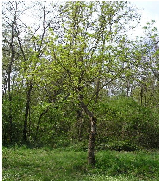
Lisière de bois