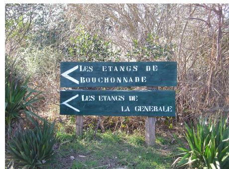
Balisage pour se rendre aux étangs