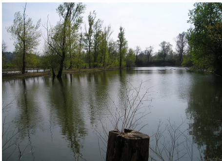
Vue de l'étang « la générale »