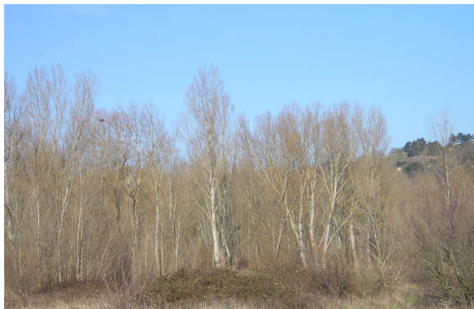
Bois de peupliers blancs (fin hiver)